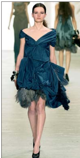
La mujer irá perfecta a un cóctel de gala con un vestido de cóctel y un taconazo de charol. Como abrigo, lo mejor es una estola de piel. Él irá impecable con un esmoquin de solapas acabadas en punta y pajarita.

Siguiendo con el calendario de de fiestas navideñas, sólo una semana después se topará de lleno con Nochevieja. Todo comienza con la cena que, a diferencia de la de Nochebuena, suele tener menos connotaciones familiares. Si decide arriesgar y convertirse en el anfitrión de la última velada del año, tendrá que ir vestido a tono con los invitados. No por estar en su casa debe recibirlos en zapatillas y con ese jersey tan ca-